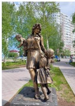
Сквер матери и материнства