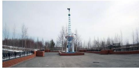
Стелла «Первая скважина на Самотлоре»