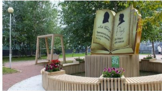
Литературный сквер Нижневартовска