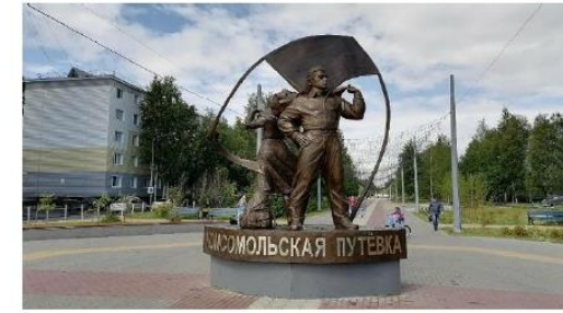
монумент "Молодость моя комсомольская"