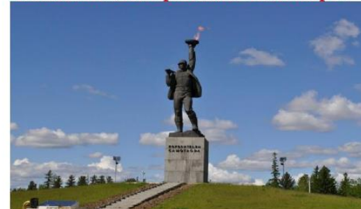
Памятник «Покорителям Самотлора»