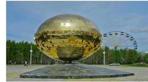
Мемориал славы нижневартовского спорта