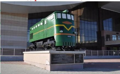
Памятник в честь открытия железнодорожного сообщения