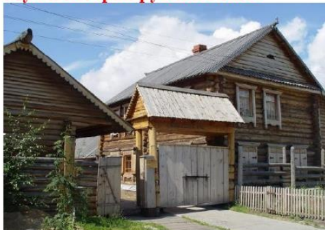
Музей истории русского быта