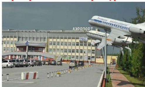
Аэропорт в честь Виктора Муравленко